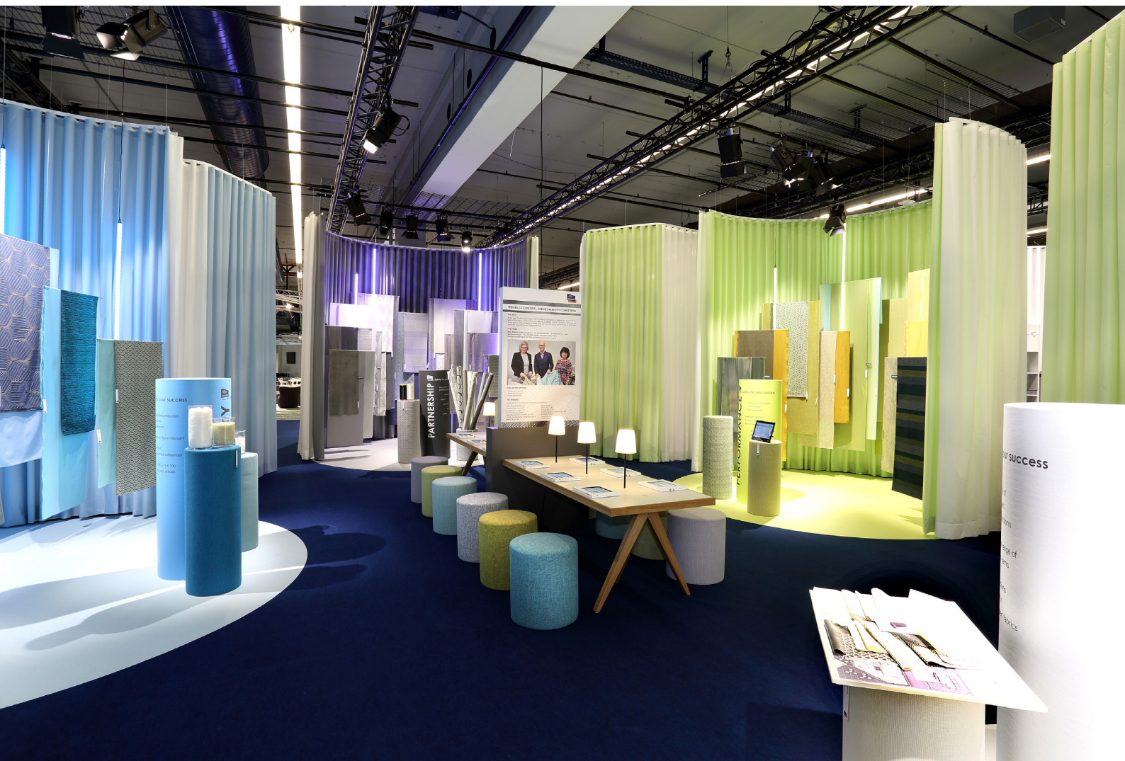
Trevira Ausstellung auf dem Heimtextil-Gemeinschaftsstand 2018