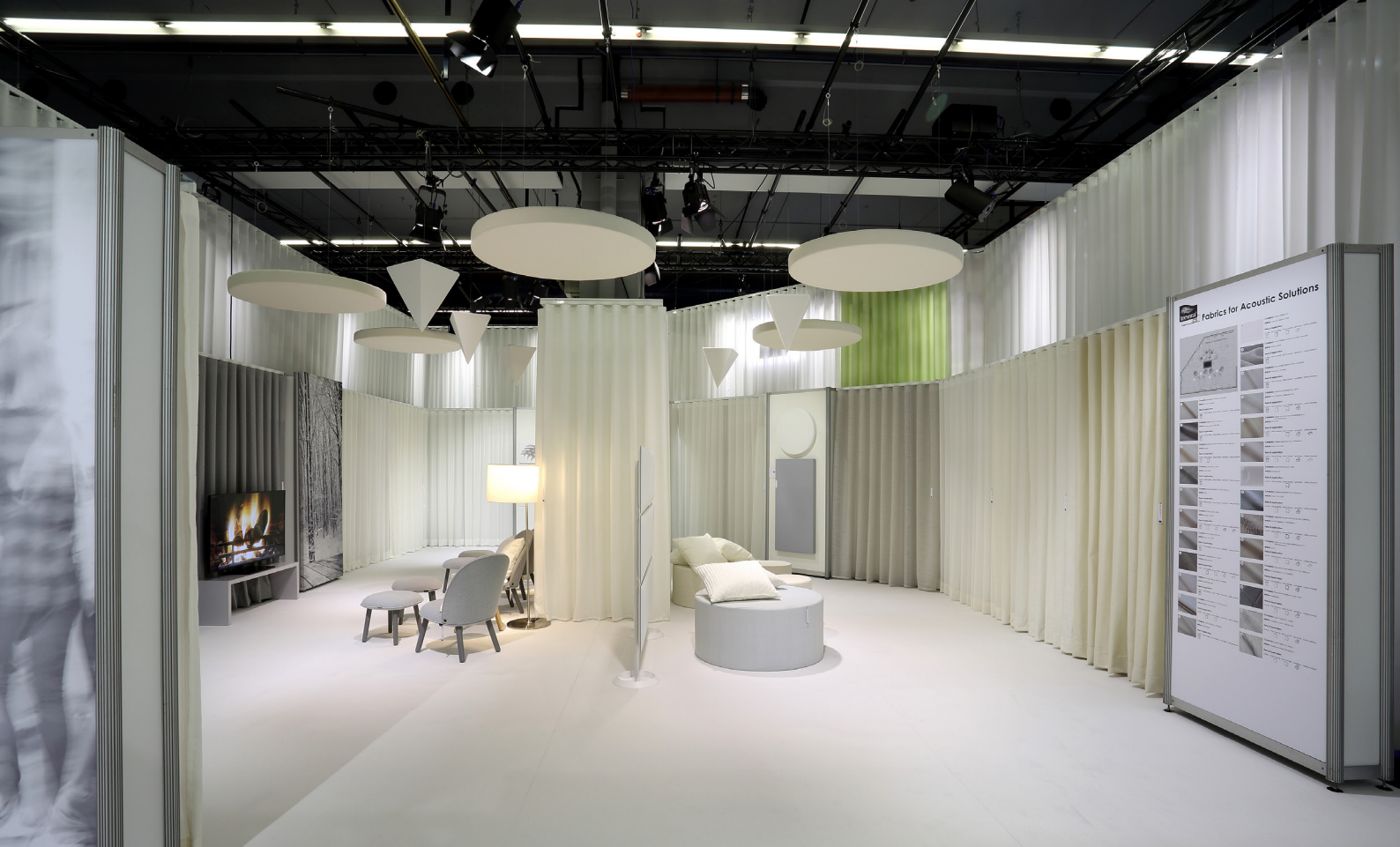
Ausstellungsraum zum Thema Akustik auf der Heimtextil 2018